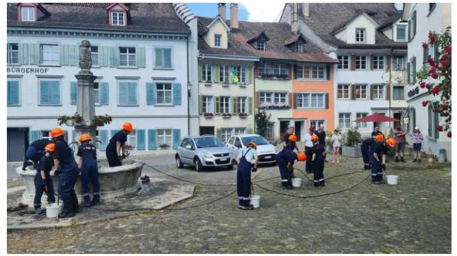
Jugendfeuerwehr in Action