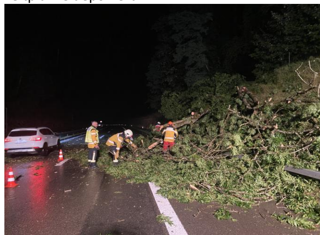
Buche auf der Autobahn

Massnahmen: Baum zersägt und hinter der Leitplanke deponiert.