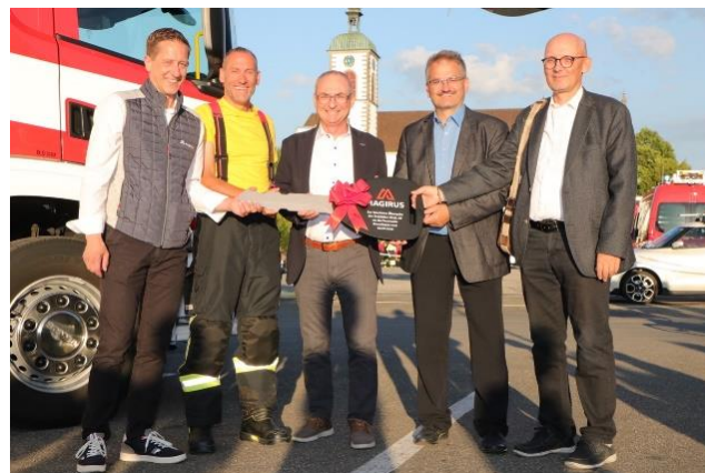
Übergabe der ADL

Anlässlich der Gesamtübung vom 03. Juli 2023 wurde die ADL feierlich der Feuerwehr Kreuzlingen übergeben.